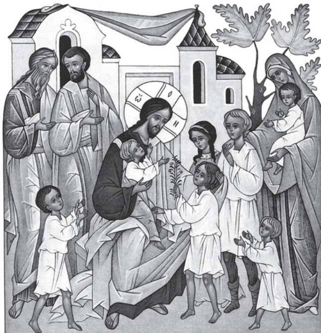
«Пустите детей и не препятствуйте им приходить ко Мне» (Мф. 19. 14)